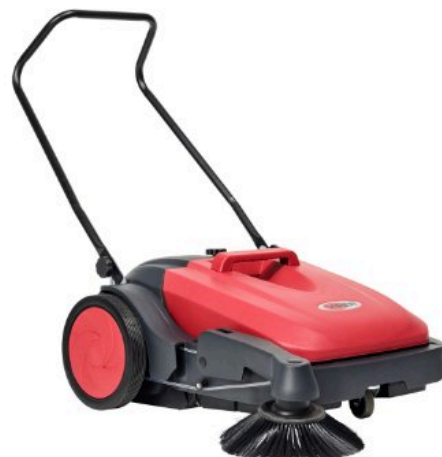
A kép illusztrációként szolgál.