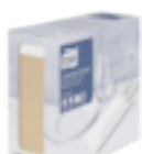
474637 Tork natúr evőeszköztartó fehér szalvétával