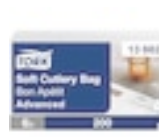
13662 Tork Soft Bon Appetit Cutlery Pocket szervíszalvéta