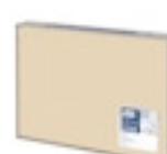
474564 Tork krémszín tányéralátét