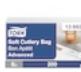
13662 Tork Soft Bon Appetit Cutlery Pocket szerviszszalvéta